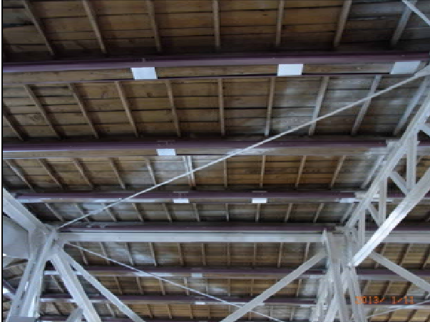
レベル調整/オープンスペース取付け