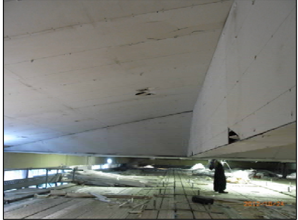
既設天井撤去前 現況