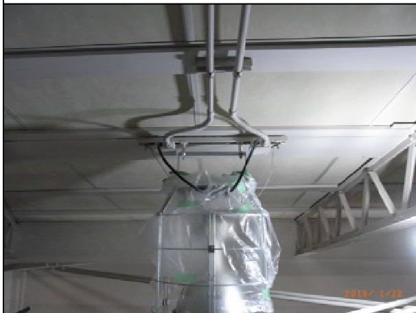
スナップ照明機器周辺