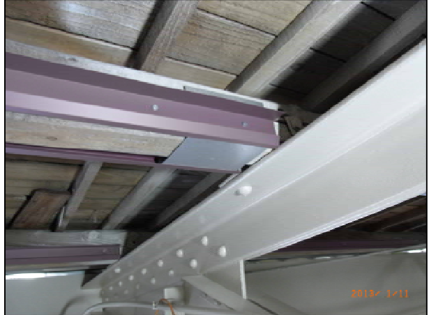
レベル調整・オープンスペース取付け