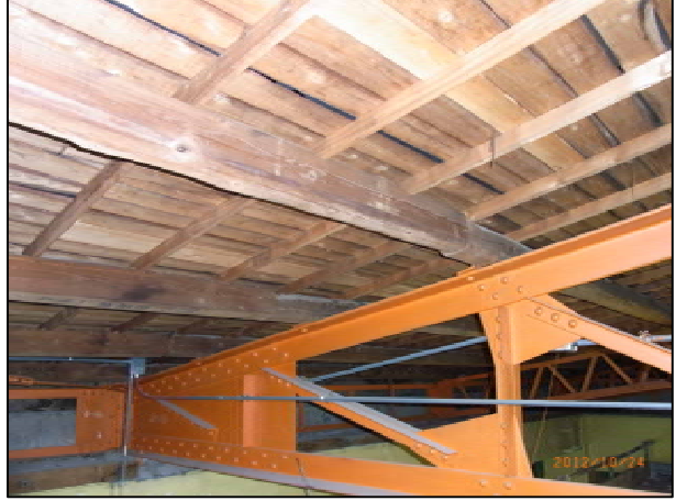
既設天井撤去状況