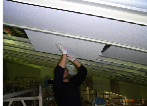
天井材t=32mm挿入 (ポリスチレン保温板t20 + 化粧ロックウール吸音板t12)