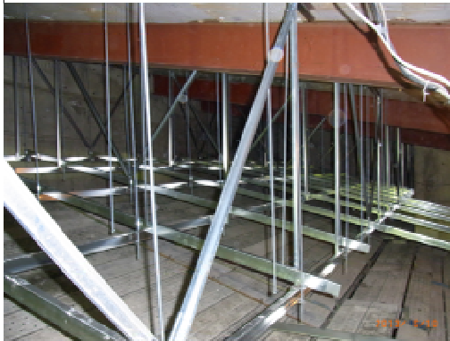
上段部下地取付状況