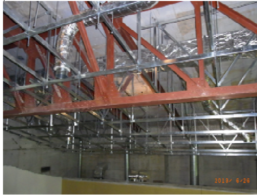
上段部下地 (空調設備取付状況)