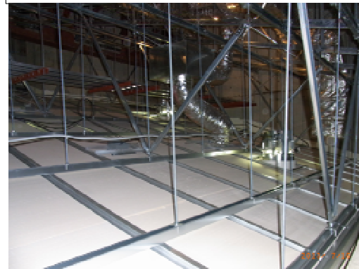
天井裏 (耐震システム下地状況)