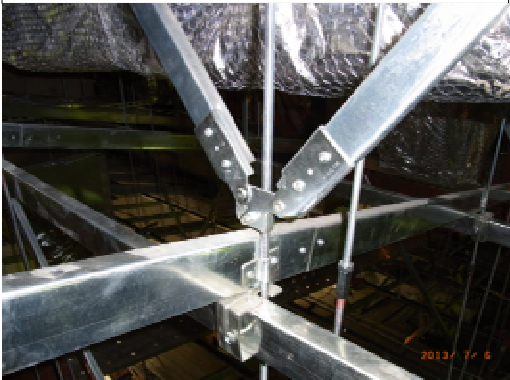
下段部下地(中間部水平・プレス補強)