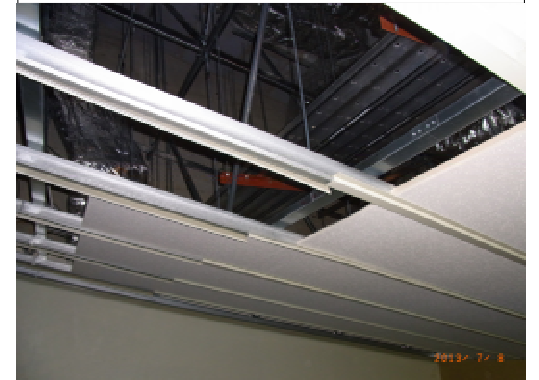
オープンサーバー・化粧ホルダー装着