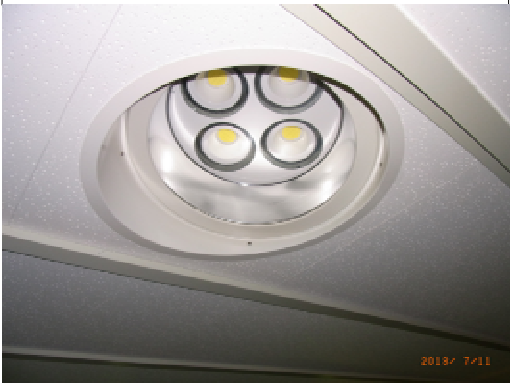
照明機器取付状況