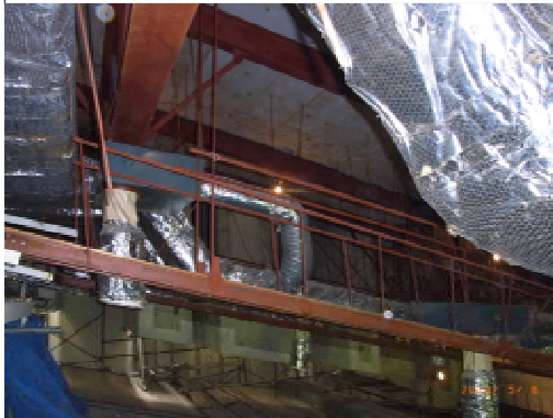
既存天井撤去状況