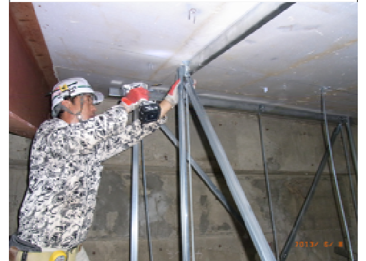
吊元部 垂直・斜めブレス取付