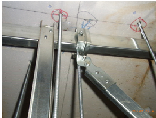
【上段部下地】上部(吊元)取付状況