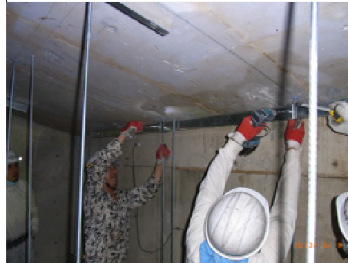
吊元部 水平補強材取付