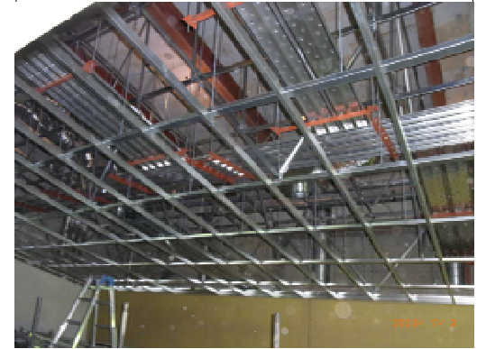
下段部下地取付状況