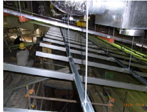
下段部下地(野縁受け・野縁取付状況)